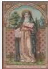
Błogosławiona Ewa z Liège - przyjaciółka św. Julianny

Święty Kacprze módl się o świętość w naszym życiu