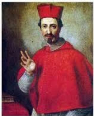
Św. Kacper . Święty mędrzec ze Wschodu,