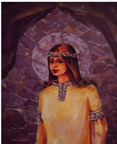
Bł. Paulina od Serca Jezusa